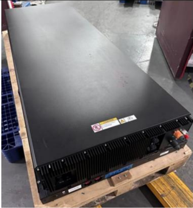
Σχήμα 3: Battery pack, ενδεικτικών διαστάσεων 800 x 250 x 2200 mm, βάρους 600 kg (υλικό προς μεταφορά). Κάθε rack περιλαμβάνει ορισμένο πλήθος cells